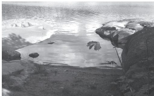
Badviken vid Klubbholmen