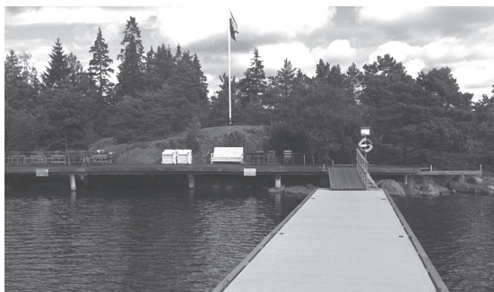
Nya bryggan vid Klubbholmen