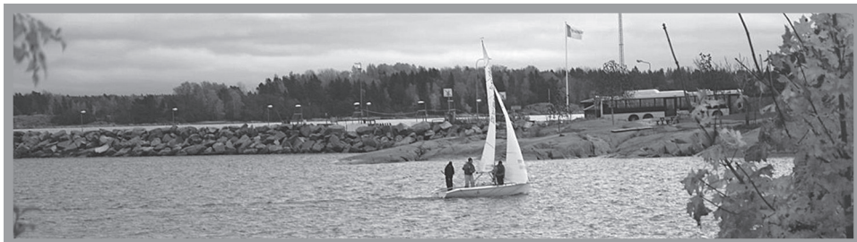
C55:a på väg in i Öregrunds hamn...