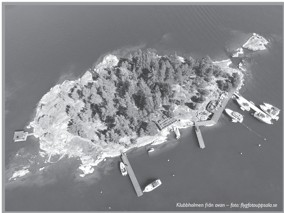
Klubbholmen från ovan