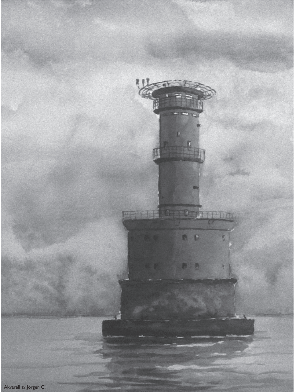
Akvarell av Jörgen C.