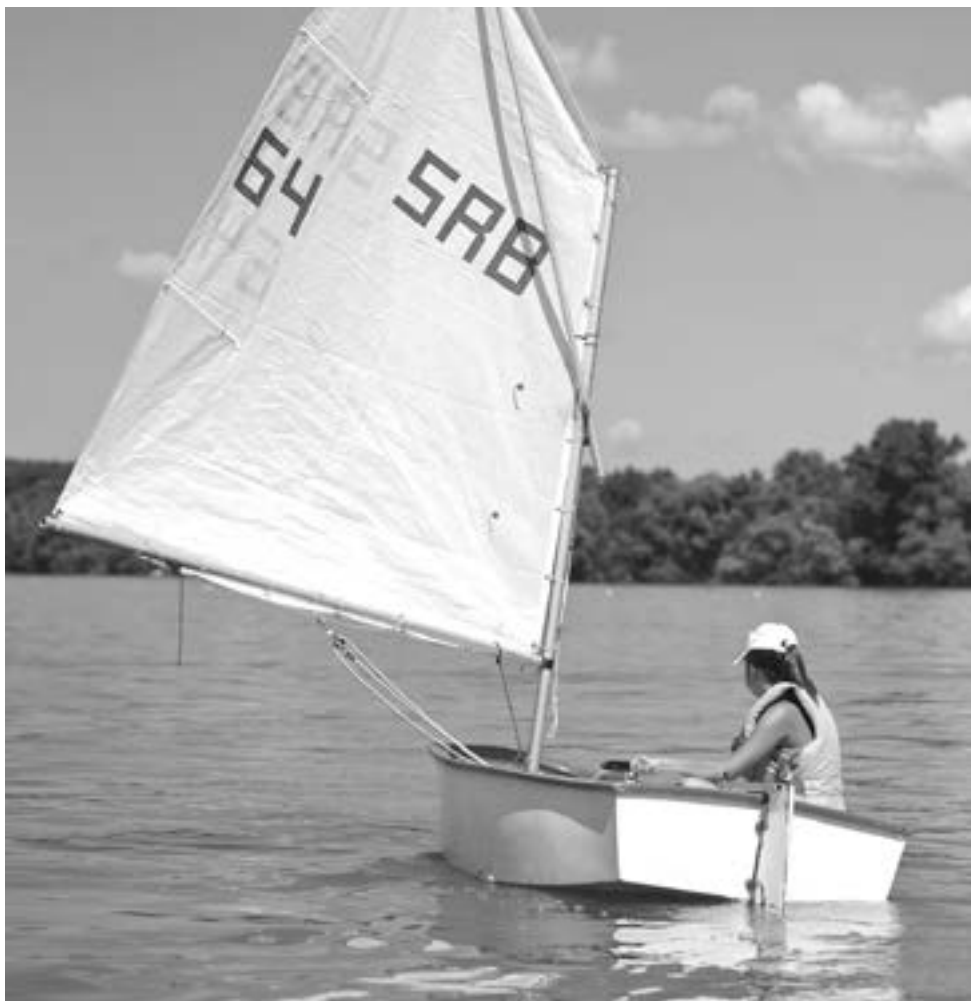
Kollot avslutas med ett seglingsrace på en kort tävlingsbana.

Lägeret startar klockan 10 på lördagsmorgonen och fortsätter till söndag eftermiddag, med övernattnig i klubbhuset.