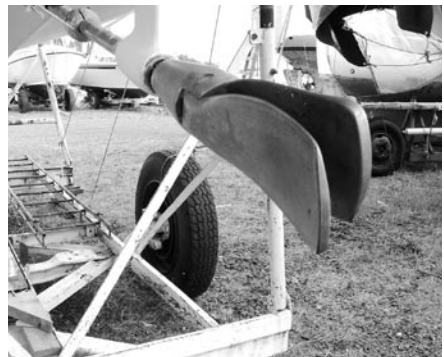
Fälls ut i nån gång 2013...