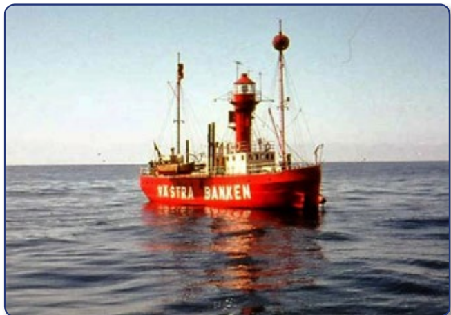
Museifyrskippet Västra Banken, medan hon låg kvar på sin bevakningsplats i slutet av 1960.