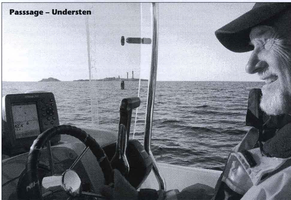
Passage – Understen