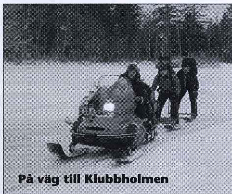
På väg till Klubbholmen