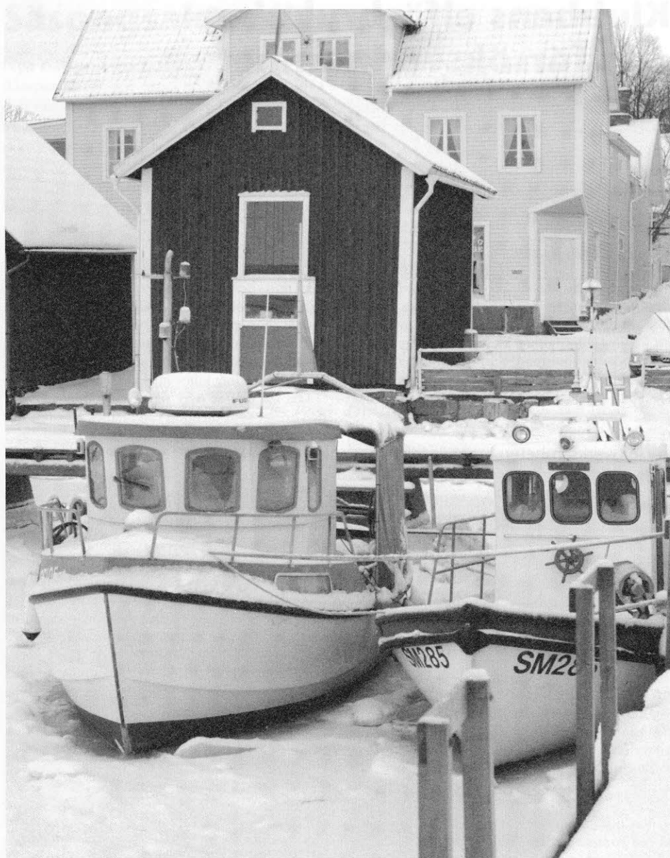
Bilder från en vinter på 90-talet...