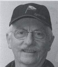
Vi syns på bøljan Janeric

Öregrunds gästhamn är en annan angelägen fråga där jag hoppas att någon eller några nya erfarna ÖBK-are kan ställa upp som Östhammars kommuns hamnvårdar och fortsätta att utveckla gästhamnen till ostkustens trivsammaste gästhamn. Vi har ju alla, förresten, möjlighet att bidra till detta genom att anmäla våra egna platser lediga till hamnvården på tel 070-392 59 90 när vi själva är ute på våra semesterseglatser.