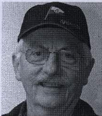
Trevliga båtsommar, Janeric

En annan sak som gläder mig mycket är att många har börjat söka upp klubbexp för att anteckna sig för de olika jobb som där finns förtecknade i klubbens arbetspärm/arbetspliktspärm. Jobben finns också på hemsidan. Vi hoppas verkligen att det här systemet ska tilltala många. Styrkan med systemet är ju att man kan välja en uppgift som man tycker passar en själv. Du är alltså väldigt välkommen att titta in på klubbexpeditionen och fynda bland den växande skaran trevliga jobb med garanterat trevliga arbetskompisar.