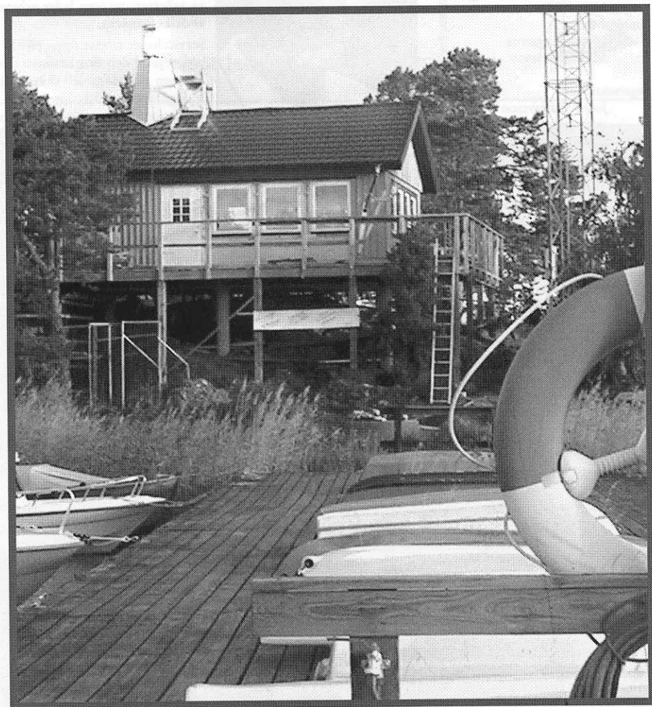
Nybyggda servicehuset står på sin plats vid Katrinörorna.