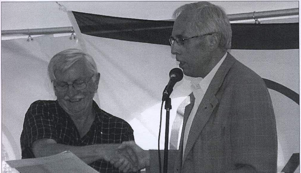
Östhammars kommun uppvaktar...