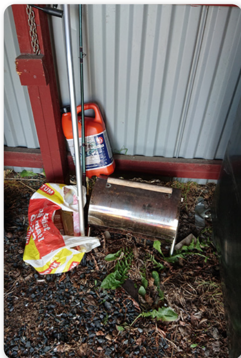
Bensindunkar, grillar och metallrör ska "nån" annan ta hand om!